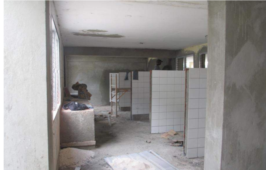
Pole Mère-Enfant de (en cours) de l'hôpital Ste Thérèse de Miragoane Financement: France via AFD