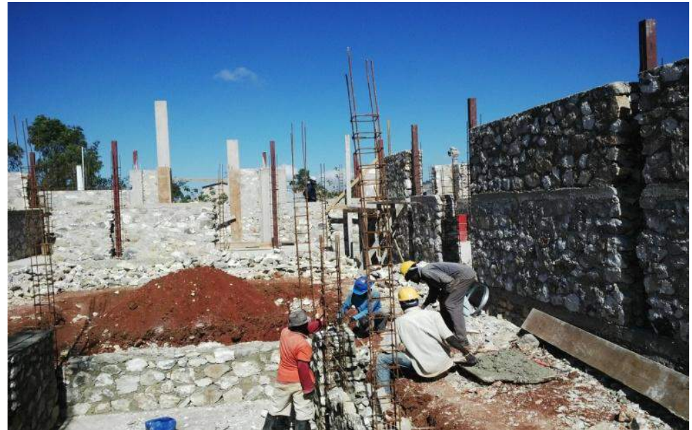
Construction du Centre de Santé de Montagne Terrible (Saut d'eau) – Financement Trésor Public (Investissement)