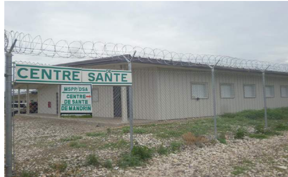
Centres de Santé de Pont Gaudin et Mandrin (Gonaives)- Financement Southcom Brigade USA