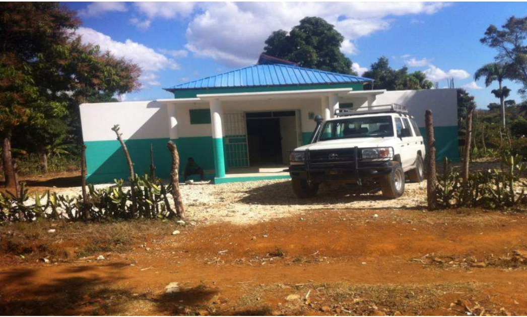
Reconstruction du dispensaire de Coupe Mardi-gras (Saut-d'eau) Financement Banque Mondiale (PRODEP-CECI)