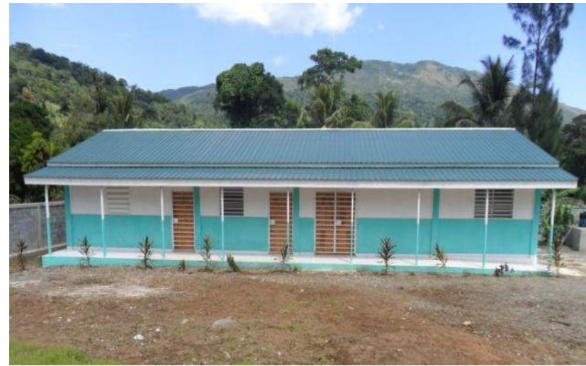
Transformation du centre de Petit Bourg du Borgne. Financement: Trésor Public – (Investissement)