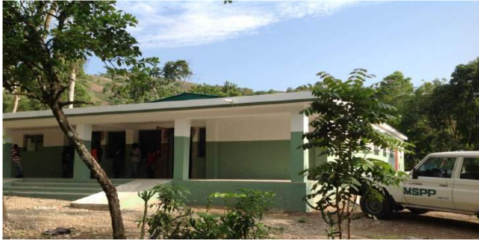
Construction du centre de Galiphète (Gde Riv. Nord) Financement: Trésor Public – (Fonds Communaux)