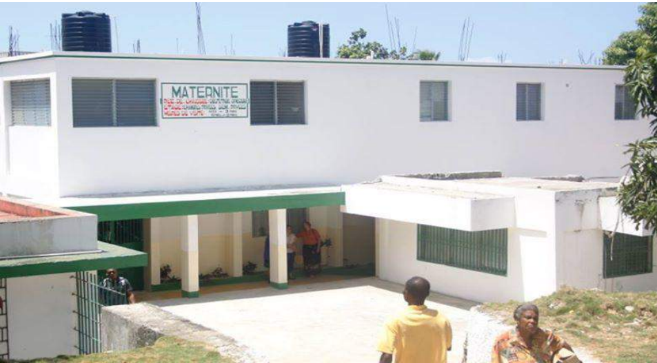
Construction du pavillon semi-privé de l'hôpital St Antoine de Jérémie Financement: Trésor Public & Groupe Santé Plus