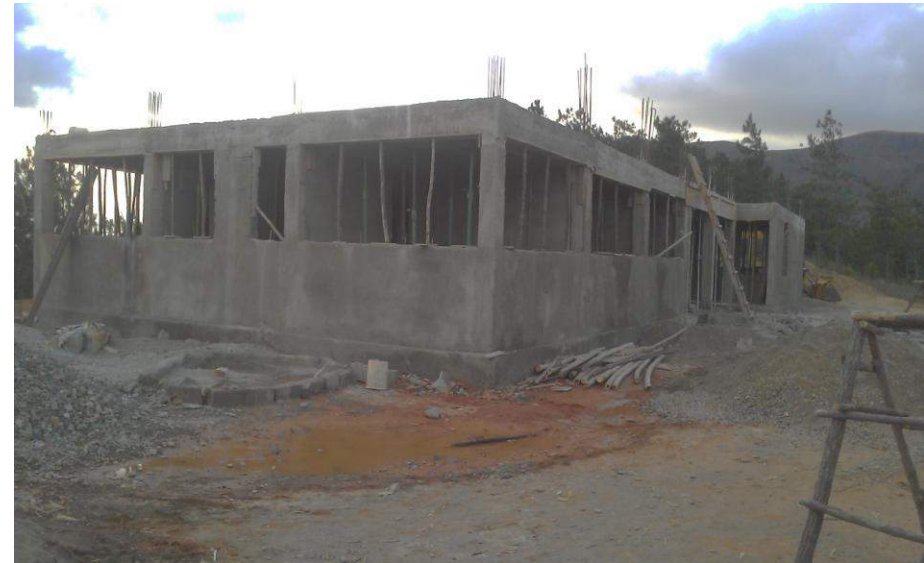
Construction du centre de santé de Vallières - Financement Banque Mondiale (PRODEP-CECI) et Trésor Public - (Investissement)