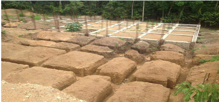
Construction du centre de santé de Caracol (Grande Rivière du Nord) Financement: Trésor Public- (Investissement)