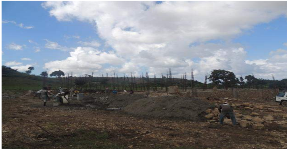
Construction du Centre de santé de la Corne (Port de Paix) Financement Trésor Public – (Investissement)