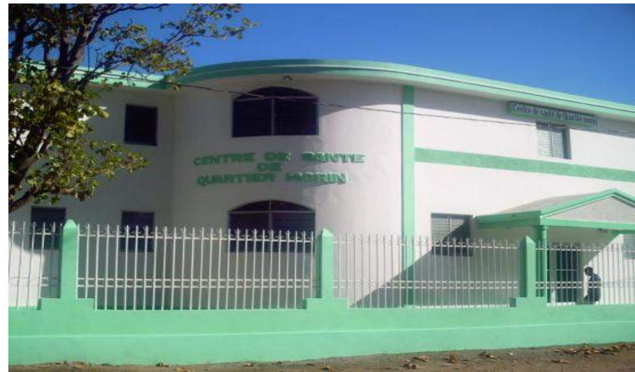
Réhabilitation centre de Quartier-Morin Financement: Coopération Cubaine