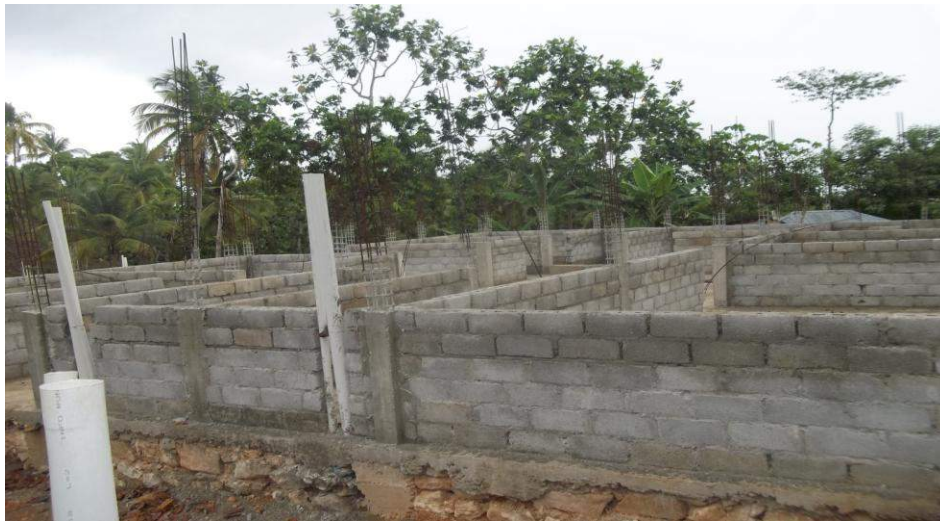
Construction du Centre de santé de St Victor (Abricots) Financement: Trésor Public (Investissement)