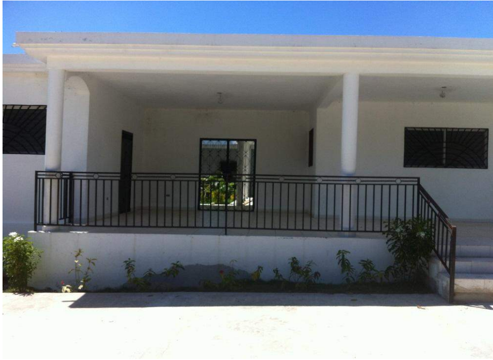
Reconstruction du CDS de MARMONT Financement: MEDISHARE

Rehabilitation du Dispensaire de Montegrande (inachevé mais fonctionnel), Financement DSC et /Zanmi la sante