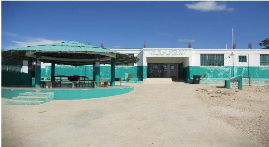
Centre de santé de Anse-Rouge Financement: Canada (CCISD)