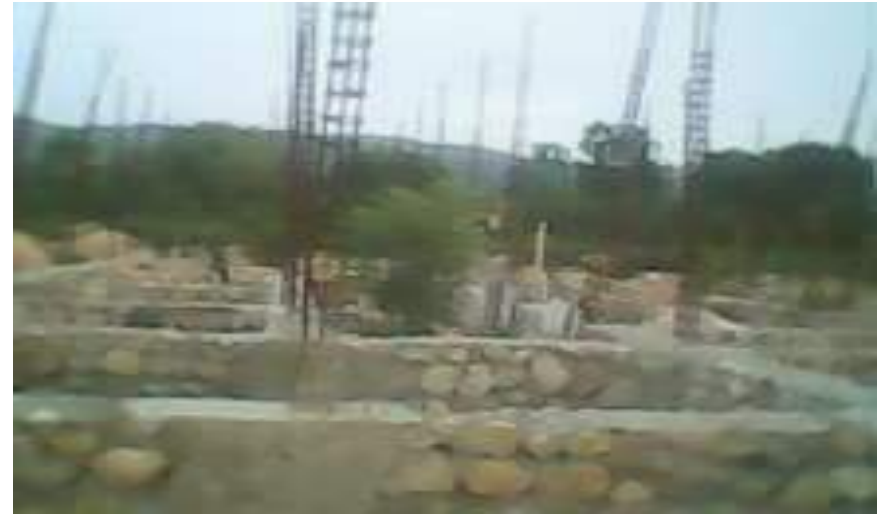
Centre de Santé -3 e Section Pte Rivière Bayonnais Financement – Trésor Public (Investissement)