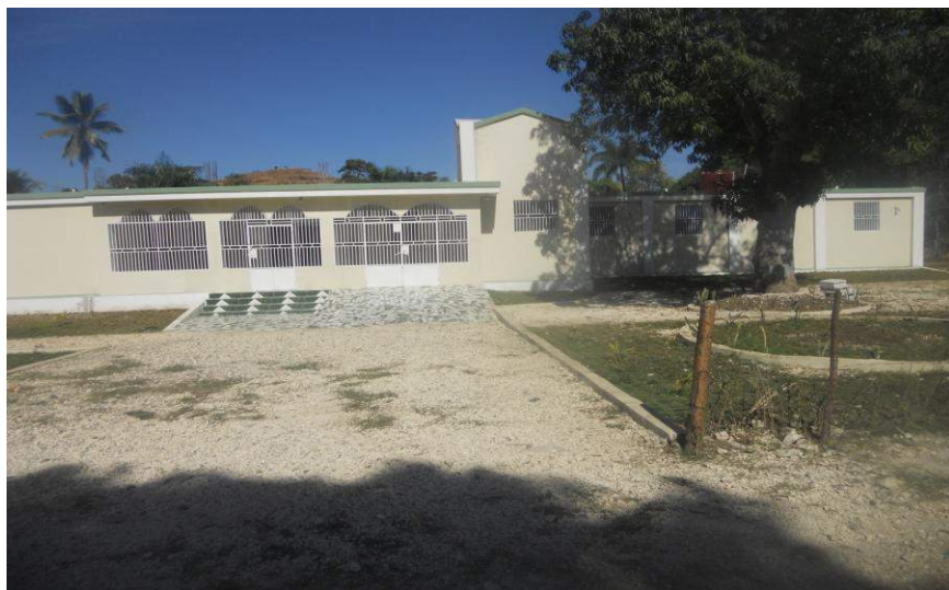
Construction du CDS de Dos Palis Financement CARITAS