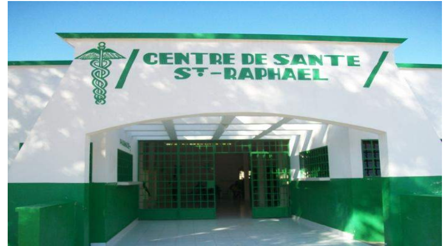
Réhabilitation du centre de santé de St Raphael- Financement: FAES