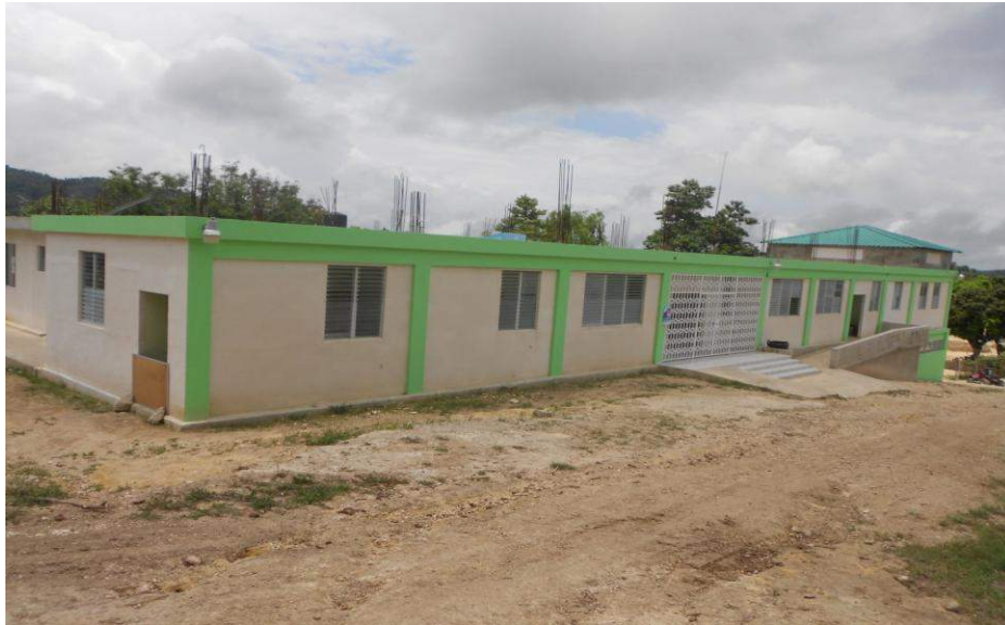
Centre de santé de Labrousse Financement: Canada (Fodes-5)