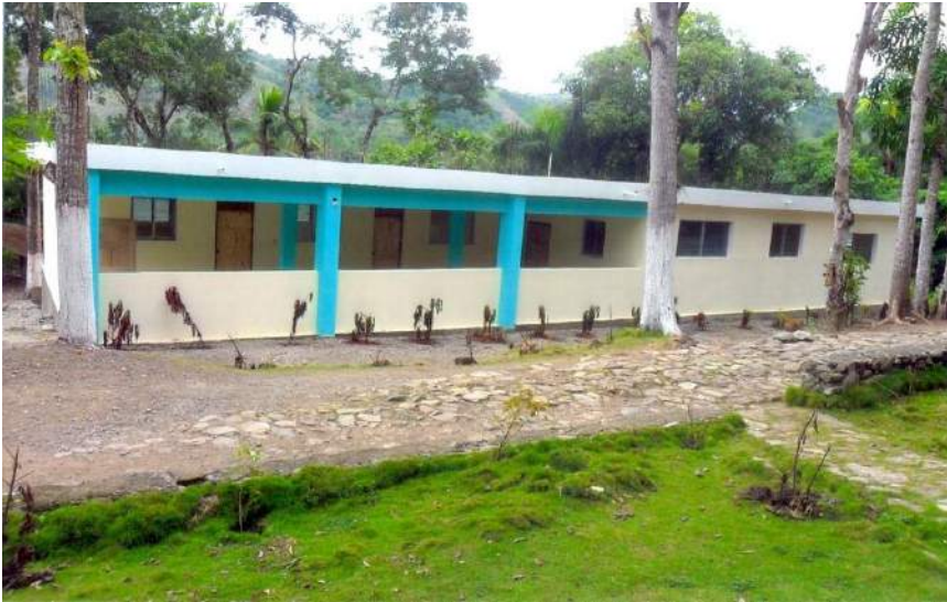
Centre de Santé de Ravine Trompette (Pilate) Financement : Eglise Catholique