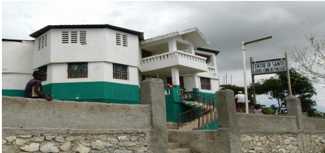
Centre communautaire de santé de Désormeaux (Dame Marie) Financement: Trésor Public (fonds communaux)