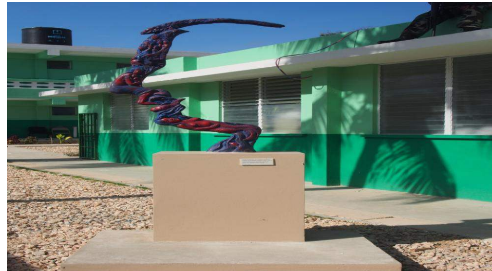
Transformation du Centre de Corail en HCR Financement: UNASUR (Argentine-Venezuela-Cuba)