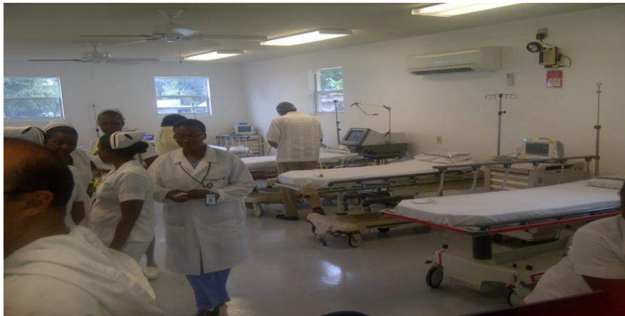
Hôpital Sacré-Cœur de Milot Clinique externe et service d'urgence