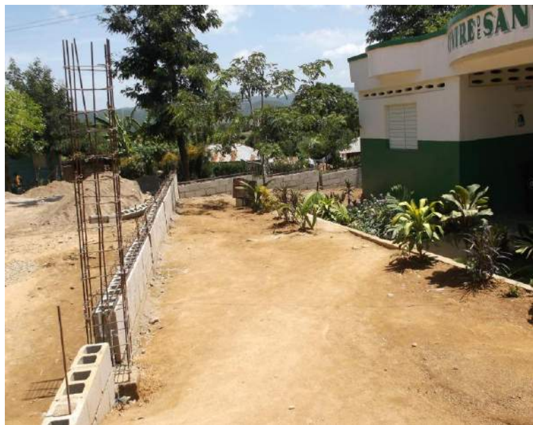
Construction d'un mur de cloture à Tilory