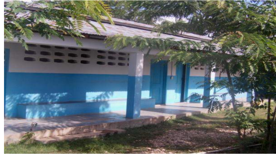
Maternité de Plassac (Pte Riv. Art) Financement: SSH ( Suisse Santé Haïti)