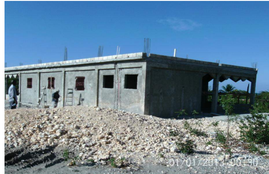
Construction du Centre de santé de Roseaux Financement: Trésor Public (Fonds Communaux)