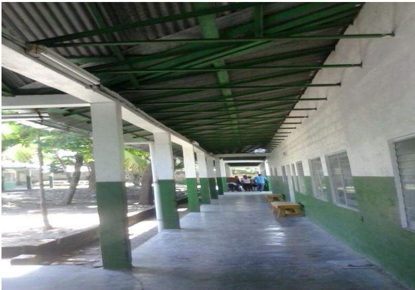
Maternité de l'Hopital Alma Mater de Gros Morne Financement CMMB