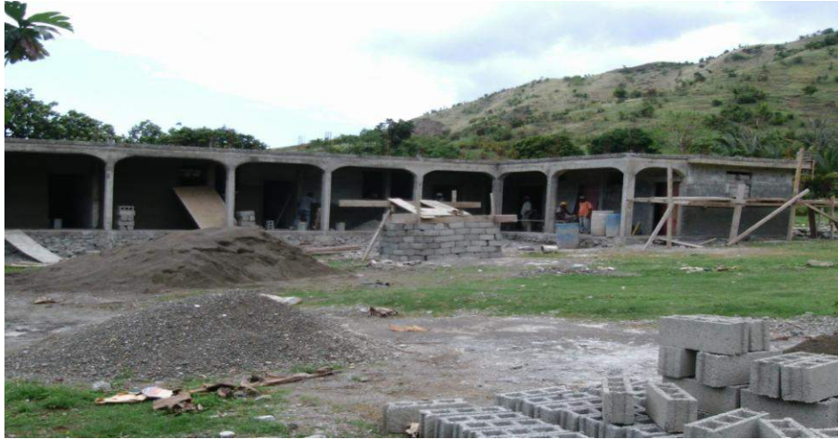
Construction du Centre communautaire de Carcasse (Les Irois) Financement: Trésor Public (Fonds Communaux)