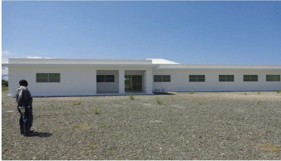
Construction du centre de Caracol- zone Champin- Parc Industriel- Financement Trésor Public – (Investissement)