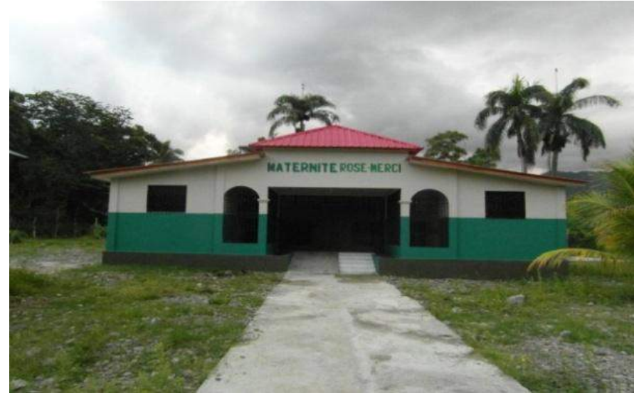
Maternité à Robillard (Plaine du Nord) Financement: Église Catholique