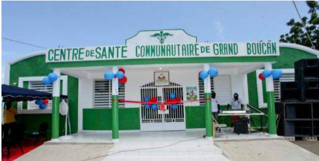
Centre de santé de Grand Boucan Financement: Association des Grands Boucanois, MSH, MSPP, Participation communautaire