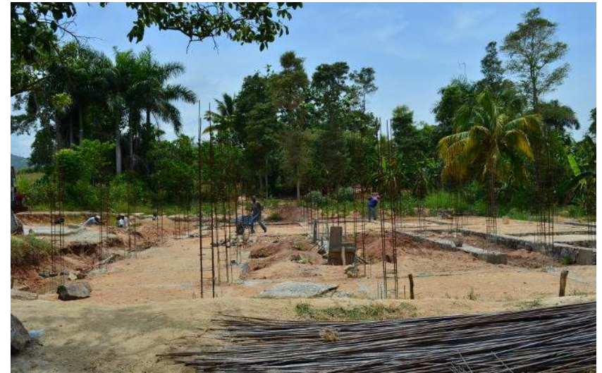
Construction du centre de santé de la 3 e section Savane Longue Financement: Trésor Public- (Investissement)