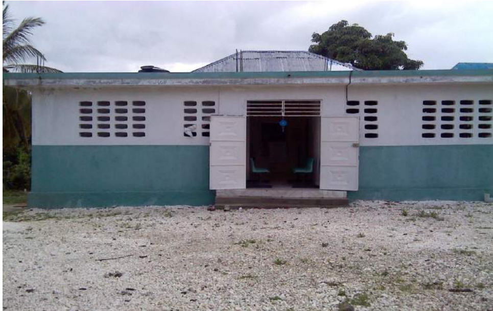
Dispensaire de Morisseau (L'Asile)

Financement: Banque Mondiale (PRODEP), Participation communautaire, APREM (Diaspora) & SOLIDARITE (Bloc Sanitaire)