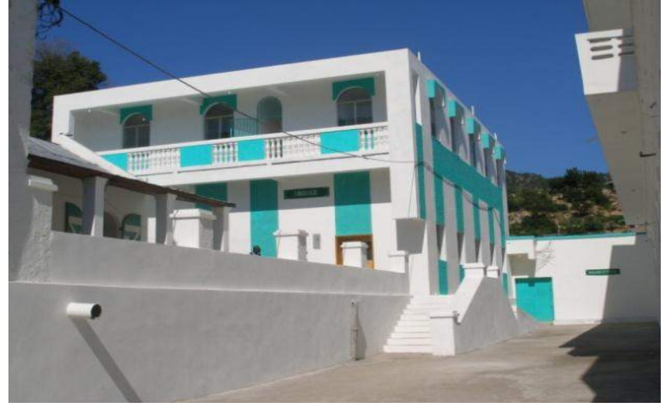
Hôpital Justinien – Réhabilitation du Service d’Urologie – Financement Trésor Public