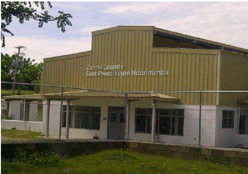
Centre de production de Nourimamba (aliment thérapeutique) Financement Zanmi la Sante