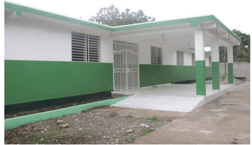
Centre de Santé de Chansolme Financement Trésor Public – (Investissement)