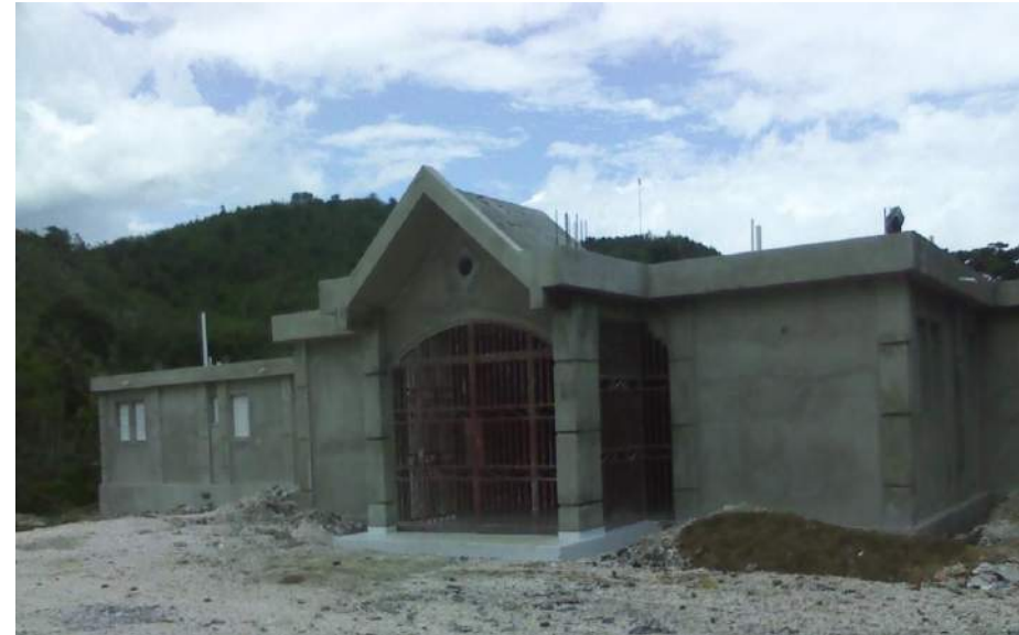
Construction du Centre de Santé de Plaisance du Sud Financement: Trésor Public (fonds communaux)