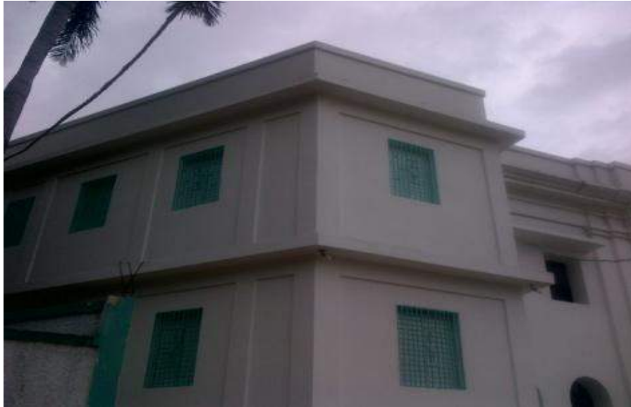
Hôpital Justinien -Bâtiment pour la prise en charge globale des violences sexuelles – Financement: MINUSTAH