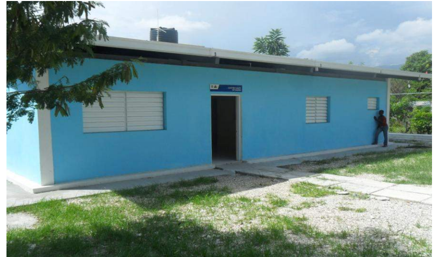
Centre de Santé de Marin (Verretes) Financement: Equateur