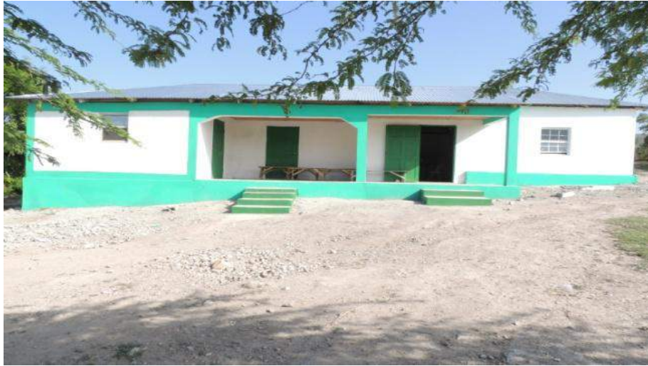
Réhabilitation du dispensaire de Passe Catabois (Port de Paix) Financement Trésor Public - (Investissement)