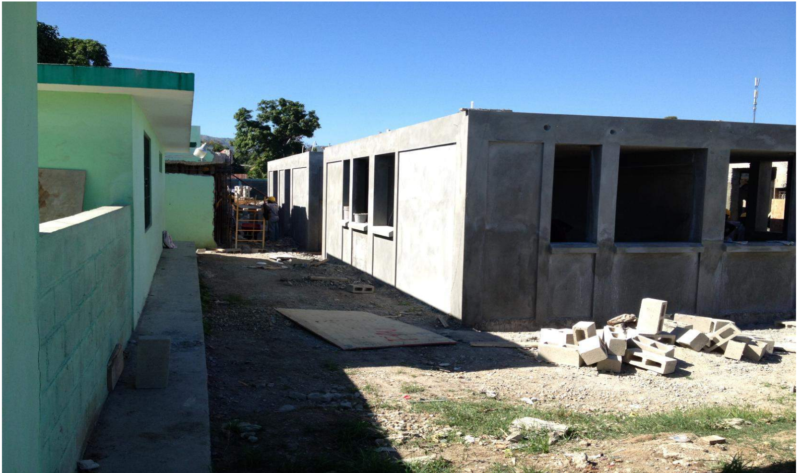
Construction maternité de Trou du Nord Financement: AFD