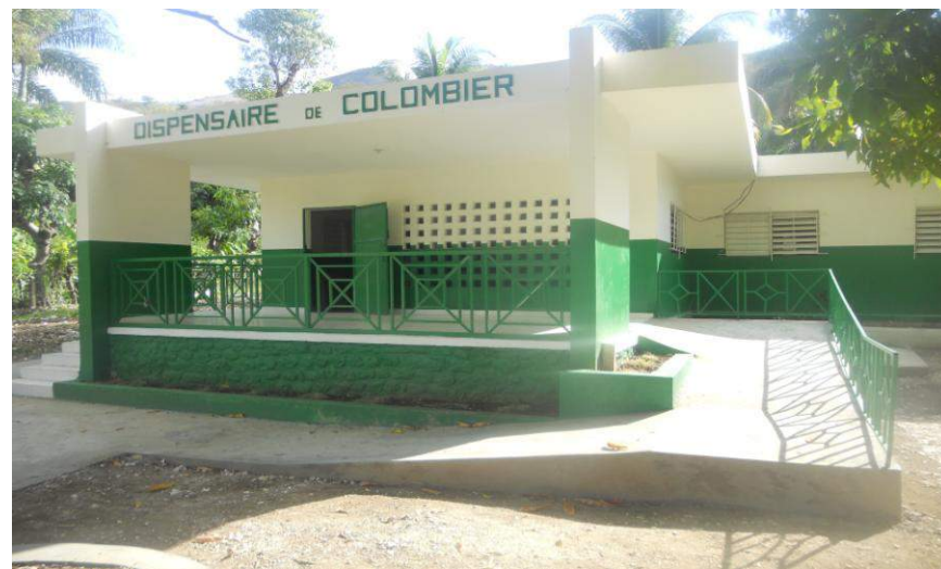
Rehabilitation du dispensaire de Colombier - Financement CECI