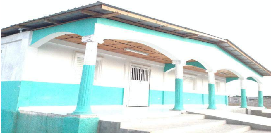
Construction du centre de Savanette (Pignon) Financement: Trésor Public (Fonds Communaux)