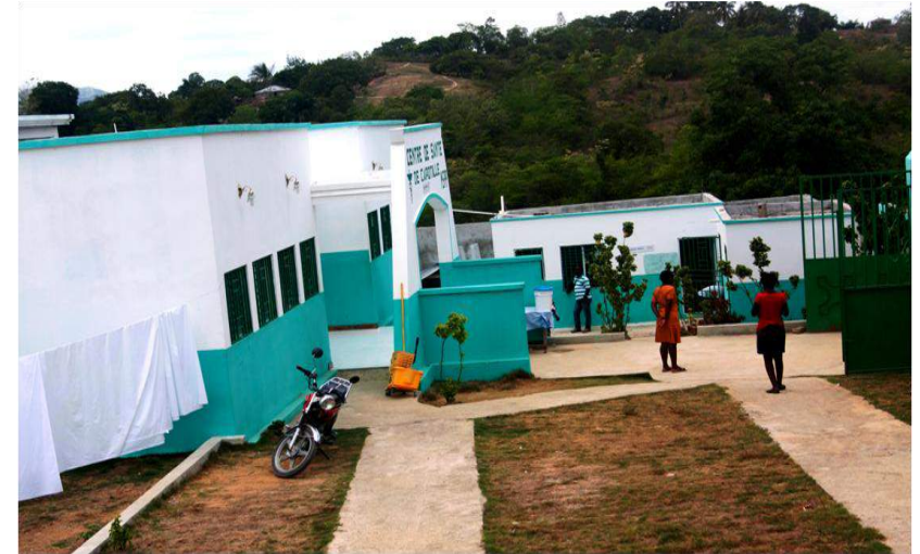
Dispensaire de Capotille: Financement Trésor Public (Fonds communaux)