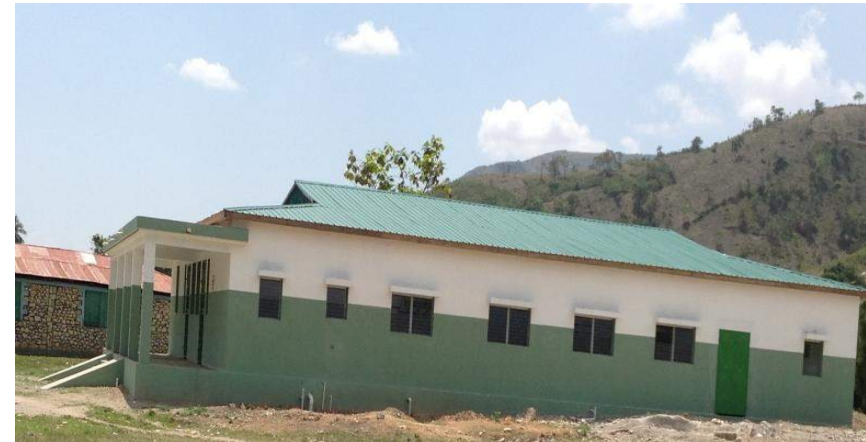
Construction du centre de santé de Bois-Neuf, St Raphael Financement: Trésor Public- (Fonds communaux)