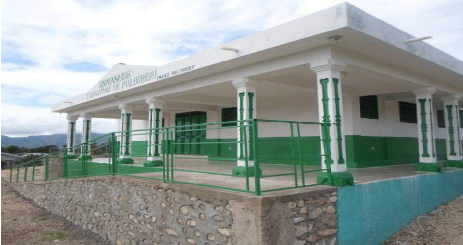
Dispensaire T. Louverture du Puilboreau (Ennery) - Financement: Banque Mondiale/ Prodep(CECI)