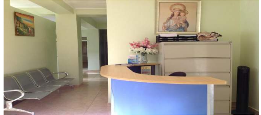
Centre St-Malachy à Port-Margot

Financement: Congrégation Sœurs Dominicaines