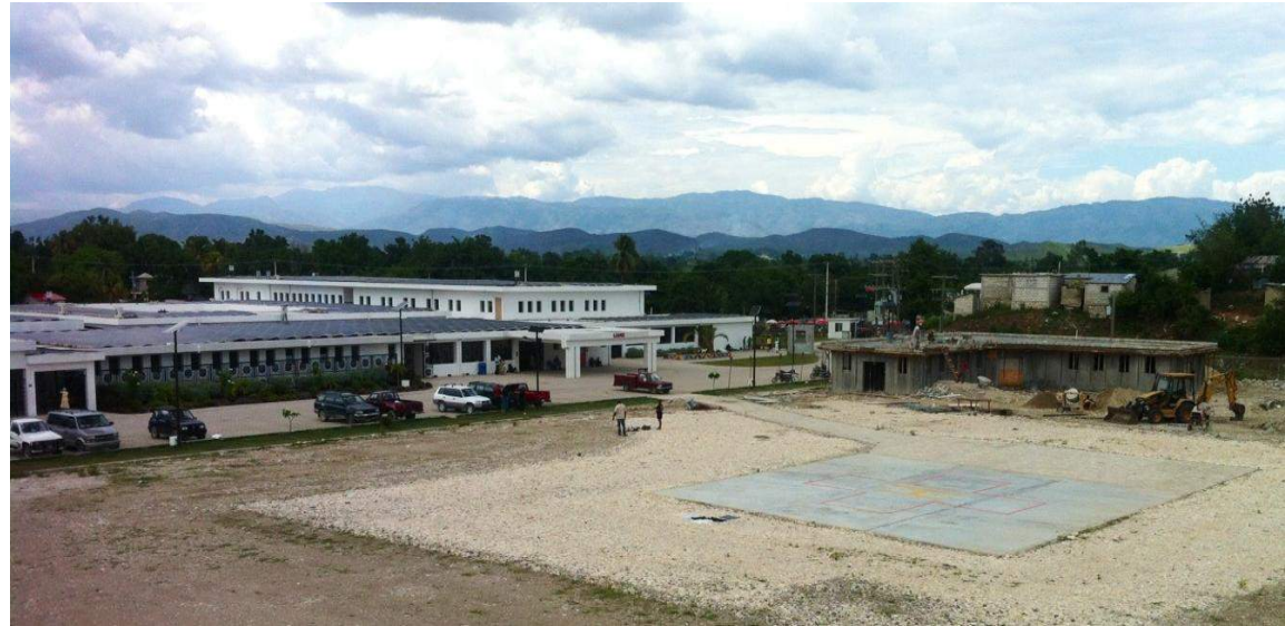
Helipad de l'hôpital de Mirebalais - Financement: MINUSTAH