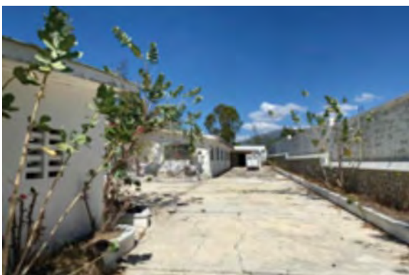
CTDA de Cameau