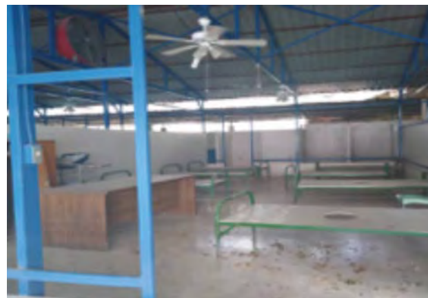
Hôpital St. Luc Espace identifié pour l'isolement