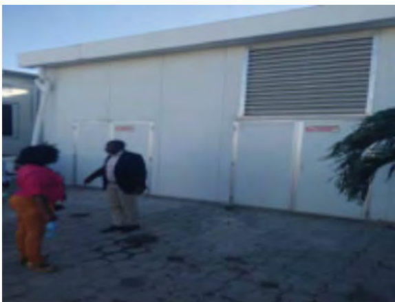
Hôpital Nicolas Armand Salle d'isolement de 6 lits