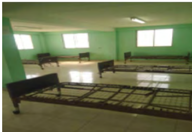
HCR de Beudet/Soins intensifs Espace identifié pour l'isolement