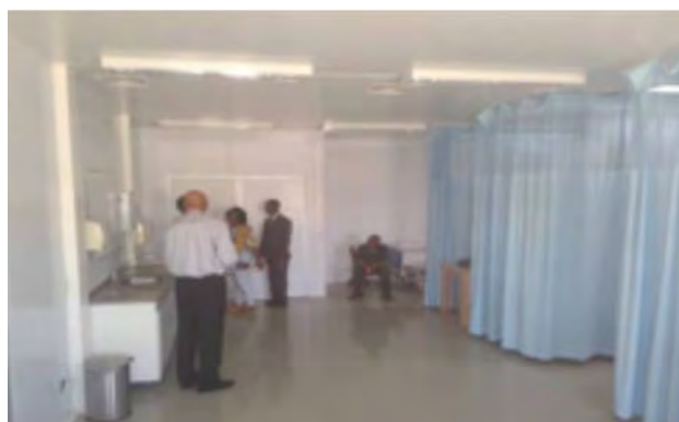
HCR de Bon repos Espace identifié pour l'isolement