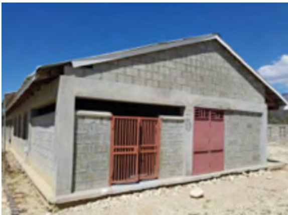
CTDA de CAZALE